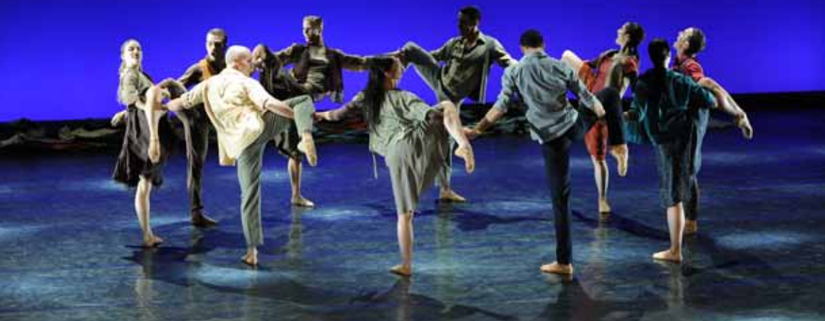
Une dernière chanson

CCN DE BIARRITZ – MALANDAIN BALLET BIARRITZ | DANSE NÉO-CLASSIQUE