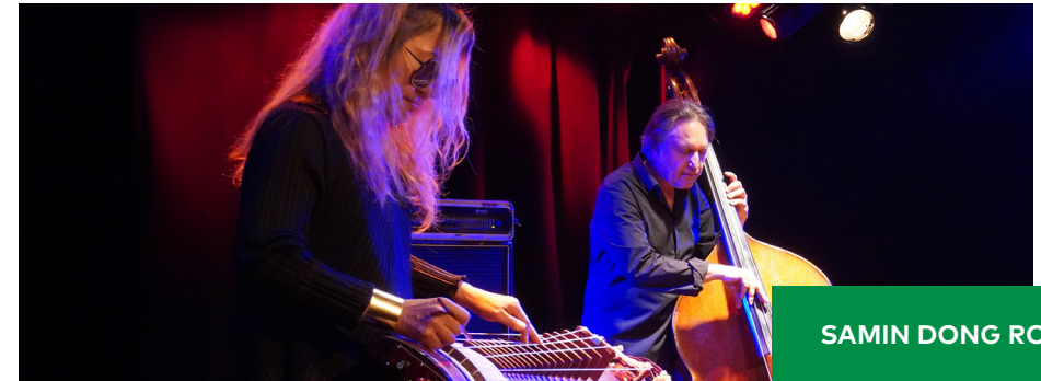
SAMIN DONG ROCK

La musicienne coréenne E' Joung-Ju s'inspire des musiques du Sanjo et du Minyo, des musiques populaires coréennes du 18 e siècle et réinvente, avec l'amplification de son instrument le geomungo, la mélodie et les rythmes de celles-ci. Avec la complicité de Simon Mary à la contrebasse, elle croise et transpose la richesse rythmique des musiques traditionnelles coréennes à des influences contemporaines rock et world.