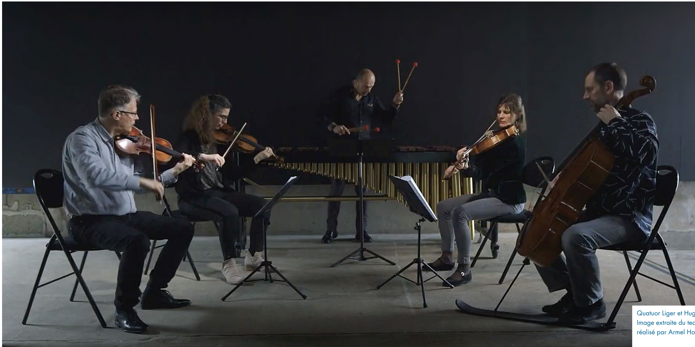
Quatuor Liger et Huggo Le Hénan Image extraite du teaser, réalisé par Armel Hostiou.